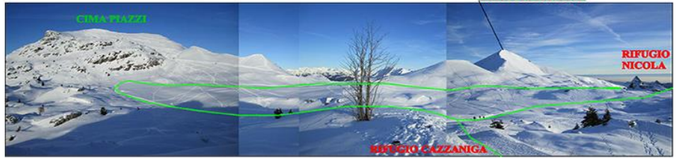
ANELLO CIASPOLE ALTO Paline Verdi