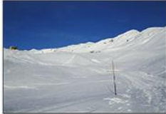
Vista sotto il Monte Sodadura