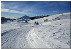
← Vista sui Piani di Artavaggio