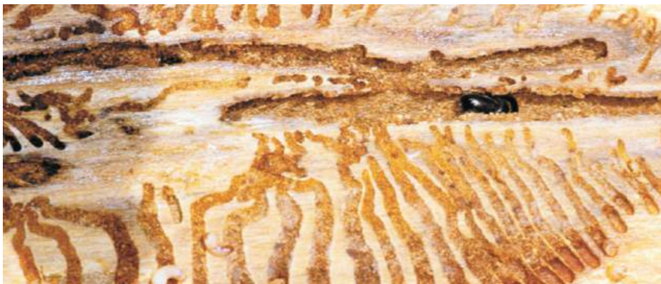
Le gallerie sotto la corteccia

Questo coleottero, di per sé, non costituisce un problema per la salute dei boschi; anzi, ha un ruolo ecologico molto importante in quanto decompositore: si nutre infatti di legno di piante a fine vita che, altrimenti, necessiterebbero di tempi molto più lunghi per trasformarsi in materia organica. Il bostrico, in particolare, utilizza le piante di abete rosso già indebolite come sito riproduttivo: in primavera i maschi realizzano una camera nuziale sotto la corteccia degli alberi ospiti e vi attraggono le femmine tramite la produzione di feromoni, sostanze chimiche che funzionano come segnali di richiamo. Dopo l'accoppiamento, la femmina scava lunghe gallerie rettilinee di circa 15 cm, in cui depone a intervalli regolari anche più di cinquanta uova. Il bostrico è conosciuto anche con il nome di insetto tipografo proprio per la curiosa "firma" che lasciano le sue larve sotto la corteccia: al momento della schiusa, infatti, iniziano a scavare gallerie secondarie perpendicolari a quella principale, con disegni nel legno che ricordano in tutto e per tutto dei