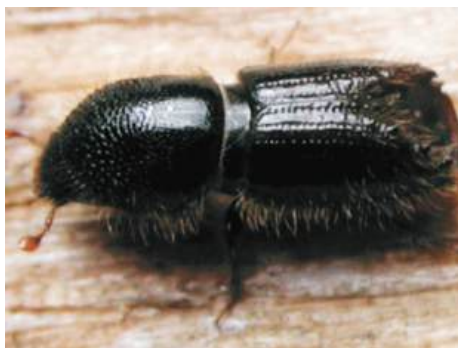
Esemplare di bostrico adulto